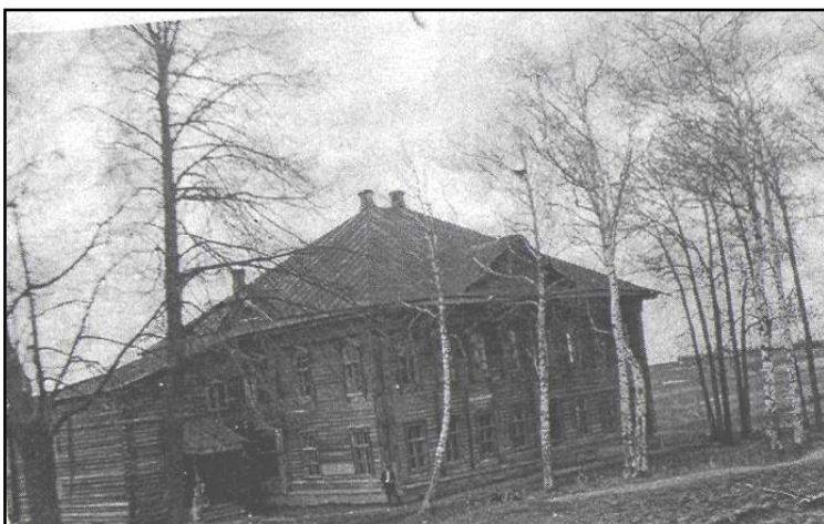
Николо-Замошская школа. Здание построено в 1898 году. Ныне здание районной библиотеки.

Основным приёмом обучения чтению было «пояснительное чтение» — ученик, читал текст, а затем пересказывал его своими словами. Учитель вёл с учениками беседу по прочитанному тексту, добавляя сведения из самых разных областей жизни, таким образом, ученики получали сведения по естествознанию, географии, истории. Физические наказания в земской школе были запрещены.