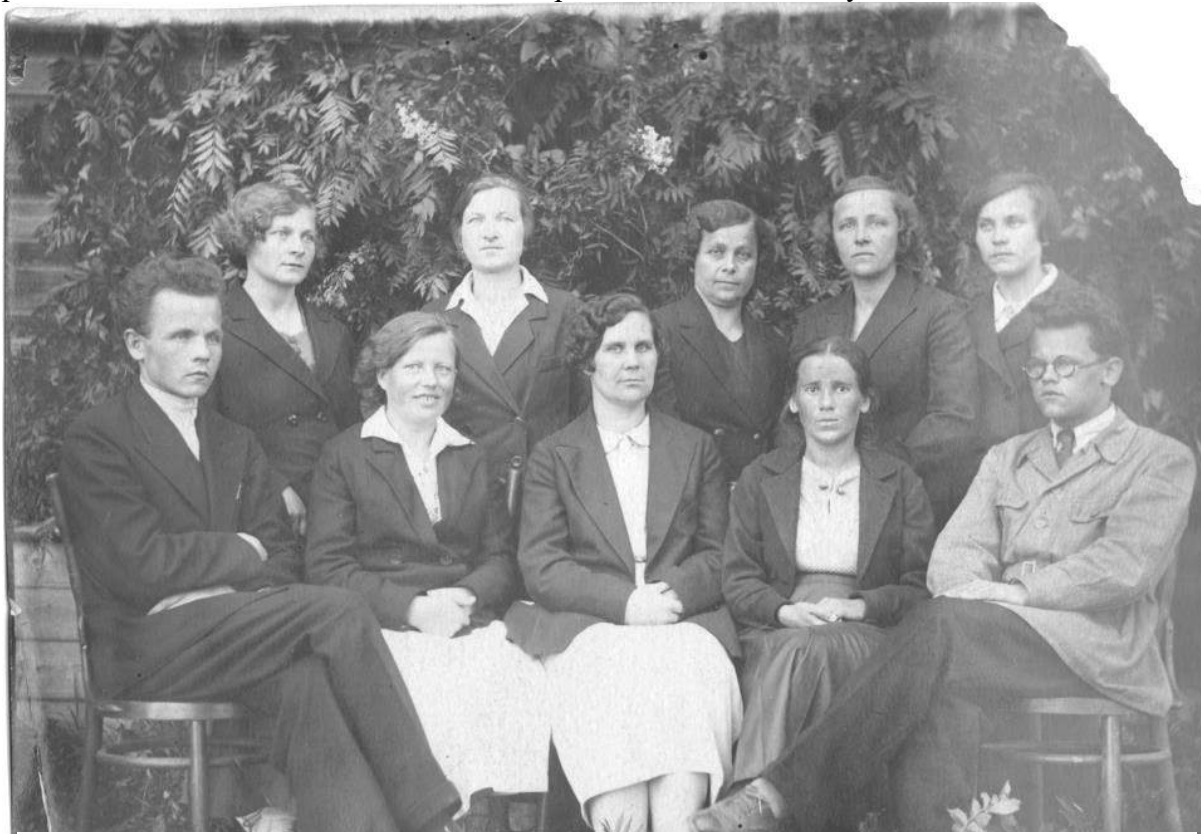
Педагогический коллектив НСШ.1936 г.

В 1932 году школы объединились под руководством Николо-Замощской школы, в которой работал более опытный, сплоченный и грамотный коллектив учителей.