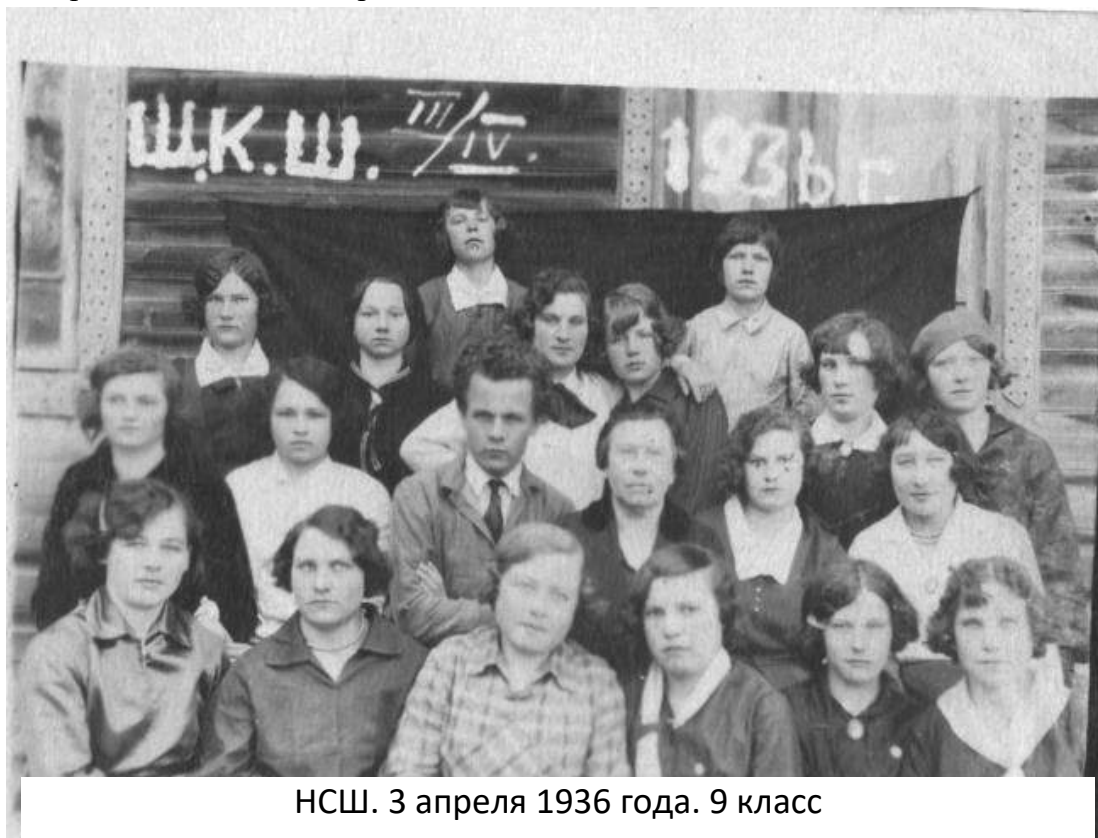
НШ. 3 апреля 1936 года. 9 класс

С возникновением административного центра на станции Некоуз в 1936 году было выстроено новое здание средней школы.