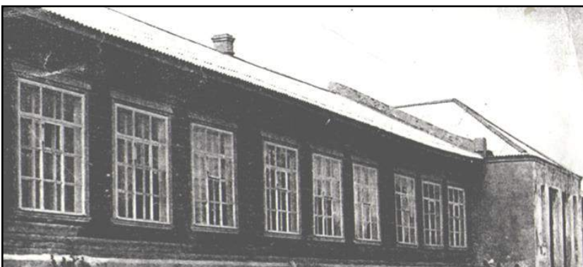
Солдатский госпиталь № 4924. Действовал с июня 1942г. по апрель 1943 года.

В солдатском было 120-150 койко-мест. 68976 раненых прошло через Некоузский госпиталь и было возвращено в строй.