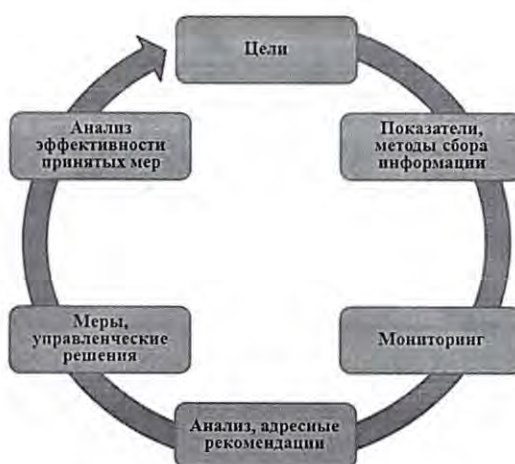
Рисунок 1. Структура управленческого цикла

Структура управленческого цикла представлена на рисунке 1.